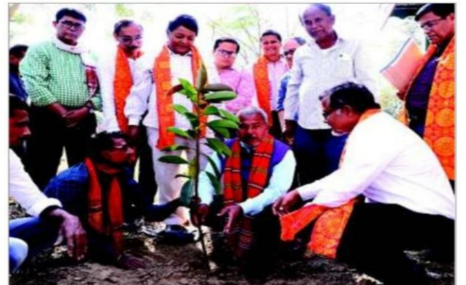
Forest Man of India Jadav Payeng planting a sapling during an ICSSR-sponsored national seminar organised by the Department of Geography, Samaguri College, Nagaon, on Wednesday.